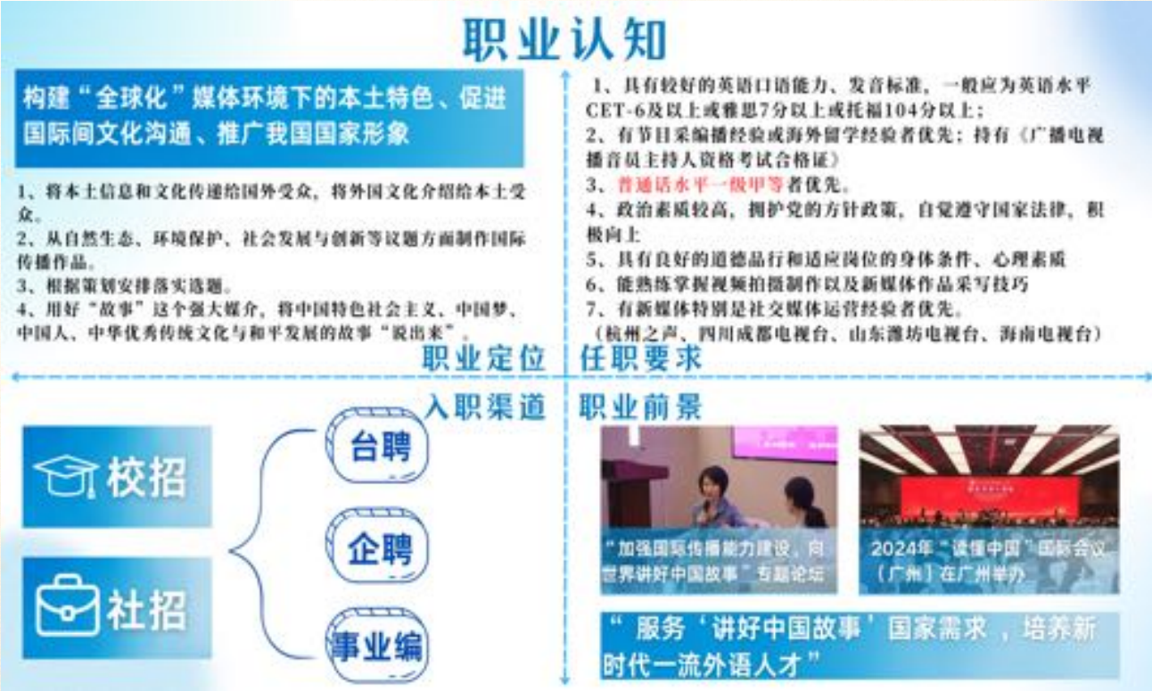
图1 针对“双语主持人”的职业探索

在充分了解双语主持人职业后，我坚定地选择了我的职业目标——成为一名优秀的双语主持人。通过咨询专业老师、访谈行业前辈、查阅官方资料、投身实践锻炼等一系列方式，我对双语主持人这一职业进行了全方位的职业探索，对职业定位、任职要求、入职渠道、职业前景等有了更加全面的认识。（图1）