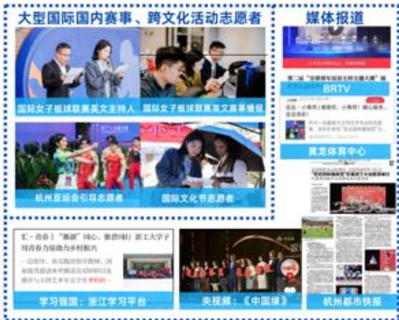
图4 大型国内国际赛事活动

4.提升笔力： 这不仅是对语言技巧的精炼掌握，更涉及对脚力、眼力和脑力的综合体现。我通过大量的阅读和写作练习，以求能够用准确、流畅的语言表达思想。曾获叶圣陶杯省一等奖、第三届全国大学生英语翻译能力竞赛省三等奖等。