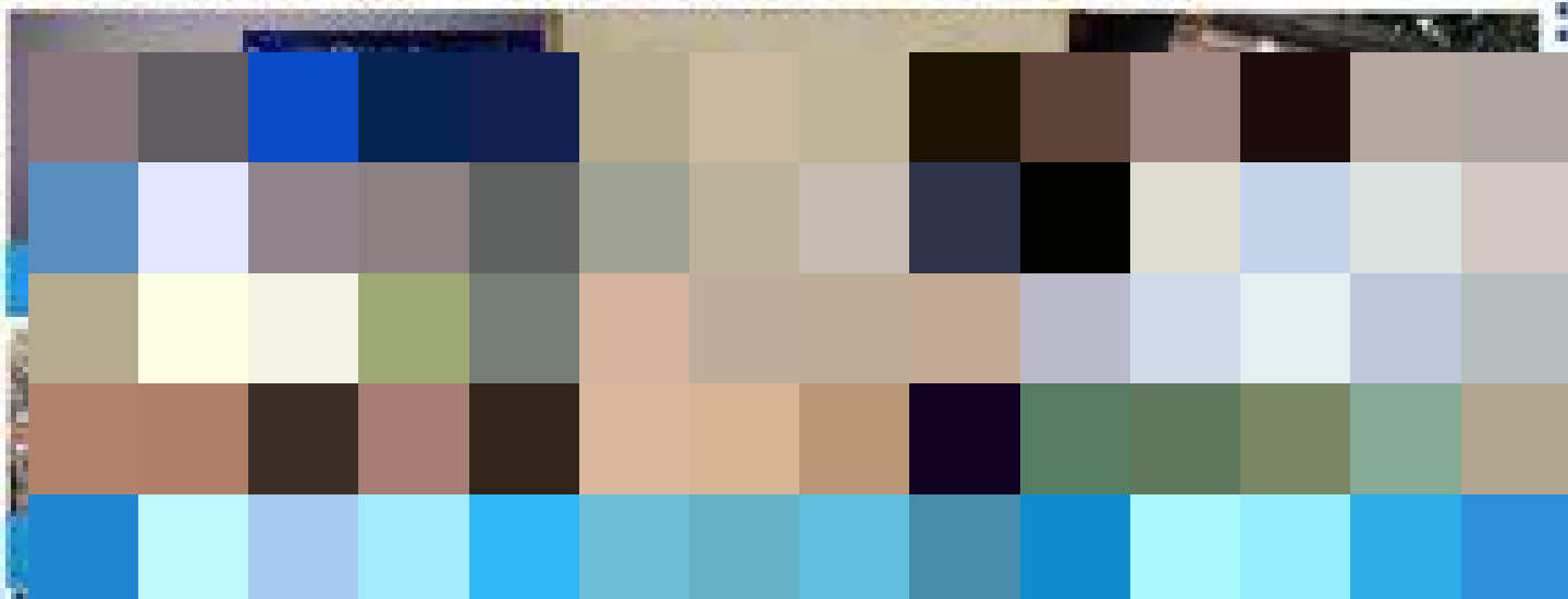
图3 跨文化双语视频创作与跨文化活动

4.增强脚力： 主持人只有在路上心里才有时代，到基层心里才有群众，在现场心里才有感动。在校期间担任各类大型活动主持20余次；积极参与大型国际国内专业赛事播报和服务：担任杭州亚运会馆英语引导及视频配音、2024“一带一路”国际女子板球联赛赛事播报、2024首届中国板球联赛英语赛事播报等。我走出校园，奔赴新疆开展“推普助力乡村振兴”志愿服务、在黑龙江记录文旅赋能城市更新的生动故事、到湖南探访流传千年的茶艺非遗、走进“中国民企500强”日出集团，担任企业海外宣传片拍摄配音；从城市到乡村，我将一个真实可感且饱含温情的故事记录下来，让自己全方位、深层次地感悟中国的多元魅力，希望自己能精准且精彩地讲述中国故事。这些积累让我收获了国家级、省市级各类专业竞赛获奖50余项。（图4）