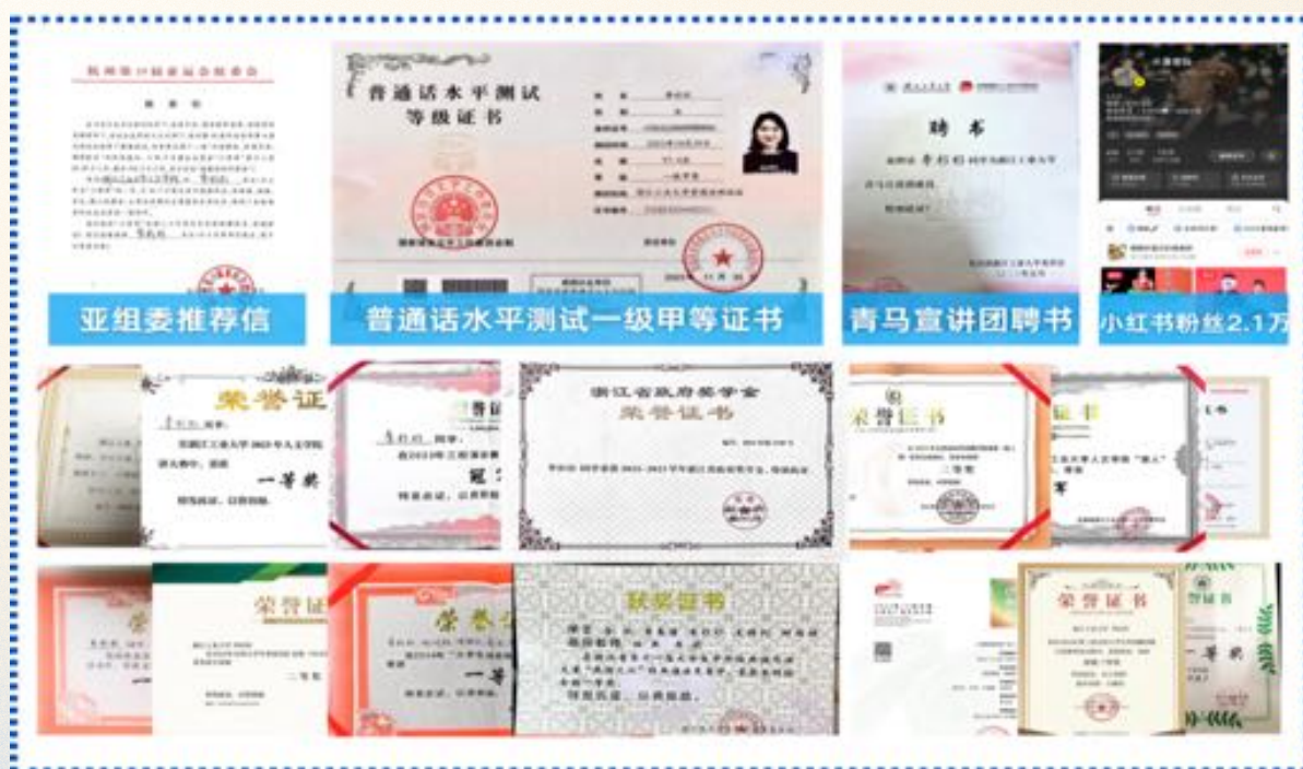
图2 大学期间各类荣誉获奖

1.激荡脑力： 身为一名学生党员，我成功入选浙江省“00后talker”，并担任校青马宣讲团成员，在理论宣讲中提升自己的政治素养。我注重拓宽个人知识视野和能力边界。我校播音与主持艺术专业是国家级一流本科专业，学校实施的“跨专业选课”制度让我能够在学习专业课程以外，广泛涉猎社会学、传播学、心理学、跨文化交际等一系列通识教育课程。大学期间我的成绩名列前茅，连续两年获得“省政府奖学金”“校优秀学生一等奖学金”，并考取了国家普通话水平测试一级甲等证书。（图2）